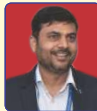
संकलनकर्ता: आदर्श गुप्ता प्रबंधक क्षेत्रीय कार्यालय दिल्ली

नोट : राजभाषा प्रश्नोत्तरी के उत्तर के लिए पृष्ठ संख्या 26 देखें